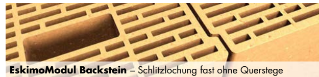
EskimoModul Backstein – Schlitzlochung fast ohne Querstege