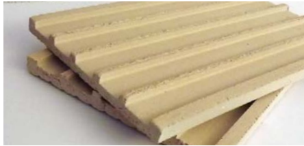
Verbundplatte ca. 1.2 cm dick

Die Besonderheit dieses Systems liegt darin, dass zwischen der Dämmplatte und dem Grundputz eine Verbundplatte aus Ton eingebracht wird.